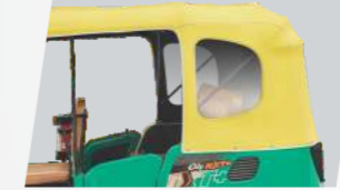
स्टायलिश हूड आणि मोठी आणि पारदर्शक खिडकी