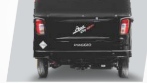
कंटेंपररी रीयर लुक्स