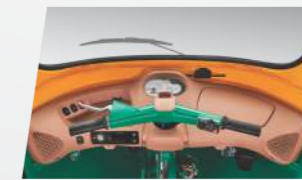
अनेक माहिती देणारा डिस्प्ले