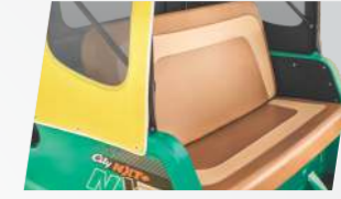
ड्यूएल टोन सीट्स