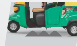
जास्त ग्राउंड क्लीअरन्स