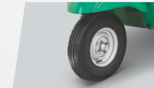
ट्यूबलेस टायर 3 व्हीलर श्रेणीमध्ये सर्वप्रथम