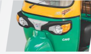
स्टायलिश फ्रंट फेशिया